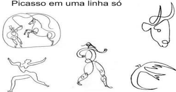
Picasso em uma linha só

→ Agora, tente fazer seus próprios contornos utilizando uma linha apenas! Utilize sua criatividade!